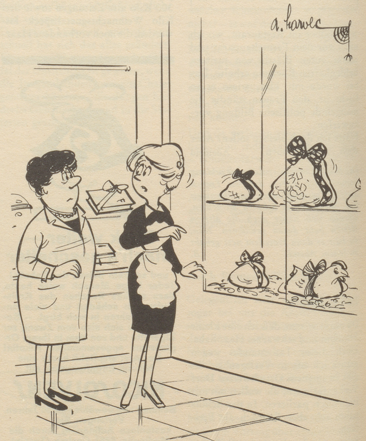
«Sött men ächt d Sunneschtere abelach?»

Ein kleiner Knirps erzählt mir auf der Straße stolz, daß er in die Metzgerei gehe und fürs Hundli Fleisch kaufe. Ich lobe ihn für sein Vorhaben und erkundige mich, was er denn für einen Hund zu Hause habe? Kurzes Nachdenken und dann zögernde Antwort: «Es Mannli.» SG