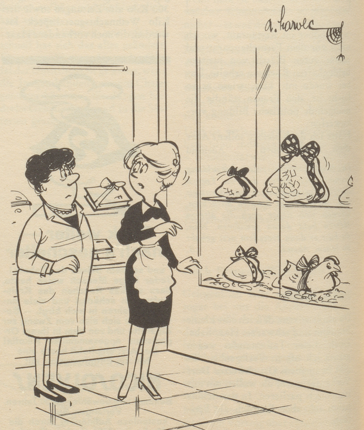
«Sött men ächt d Sunneschtere abelah?»

Ein kleiner Knirps erzählt mir auf der Straße stolz, daß er in die Metzgerei gehe und fürs Hundli Fleisch kaufe. Ich lobe ihn für sein Vorhaben und erkundige mich, was er denn für einen Hund zu Hause habe? Kurzes Nachdenken und dann zögernde Antwort: «Es Mannli.» SG