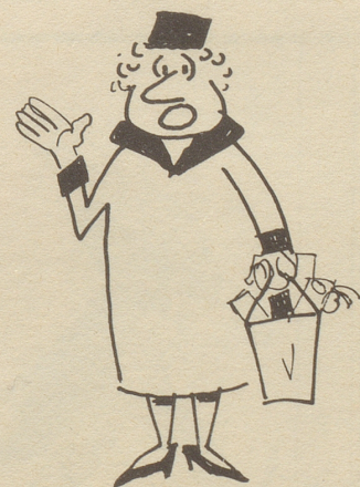
« Alles würkli modern und fortschrittlich — aber mängsmal fühl ich mich schüüli einsam da ine! »