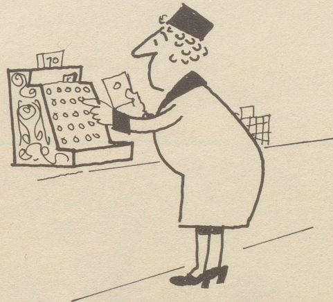
zählt selbst die Preise zusammen . . .