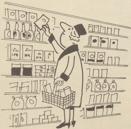
wählt selbst seine Waren aus . . .