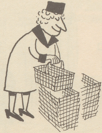
ergreift selbst einen Korb . . .