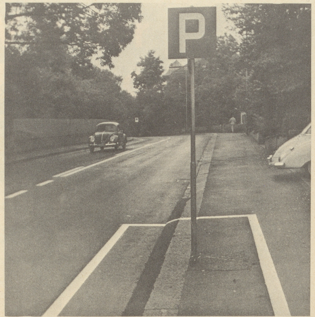
Straßenbild aus Zollikon Der Sinn für neckischen Humor kommt selbst bei Polizisten vor.

au Schüalarzittiga. Glatti Pletli. Aini vu denna Zittiga find ii abar nümme glatt. Jungi Schnuufar vu «Redakhtoor» hend gääga dä Profässar an Artikhal loosloo, wian na dar «Blickh» nitt besser färtig proocht hetti. Und zwoor isch däa Artikhal ärschinnä, trotz dar Warnig vum Rekhtar vu dar Khantoonsschual Fröüdbärg. Dua hend dRekhtoor vu da Mittalschuala beschlossa, dar Varkhauf vu därra Nummara vu dar Schüalarzittig sej uf da Schualplätz verbotta. Und jetz khunnt dar Witz. Im Khantoonroot hätt a Khantoonroot an Intarpellazioon gmacht: Was dar Regiarigroot zu därra «sachlich fundierten Berichterstattung» zsääga hej, und was ä untarnemmi, um dPressefrejhait an da Zürhrar Mittalschuala zsihara!! Khönna muasch vor Lahha! As nemmt mii khogamääsig Wundar, was für a Zittig däa Khantoonroot normaalar-wiis lääsa tuat, daß ä vu sachlicher Berichtärstattig reeda khann und was ma untar Pressefrejhait var-schtoot, sötti aigantli a Khantoonroot au besser wüssa. Noch miinara Mainig isch dia Intarpellazioon halt widar ammol a politisch Sach. Wenn zum Bejschpiil aswäär Regiarigroot wärda will, denn muaß ä bejzitta darzua luaga. Und zum Bejschpiil sääga: Wenn i jetz für dia Schüalar a Lanza brähha, au wenn sii zSchtimmrächt no nitt hend, so hends as sihar denn, wenn ii als Regiarigroot khandi-diara. Abar wia gsaid, das isch nu asoo mini Mainig.