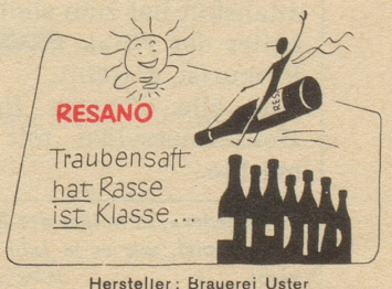
Hersteller: Brauerei Uster