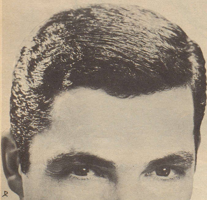
Parfumerie Franco-Suisse, Ewald & Cie. AG, Pratteln/Basel