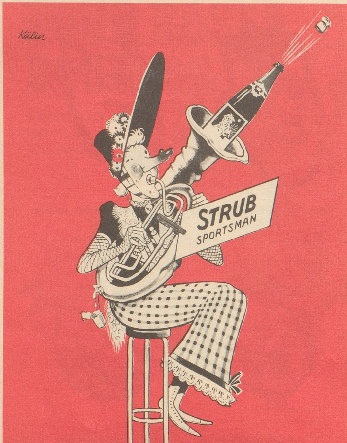
„Strub“ Mathiss & Co., vins mousseux, 4000 Basel 13 Telephon 061 / 43 04 00

★★★★ Verzicht? — Nein! Eine wohlschmeckende leichte Cigarillos