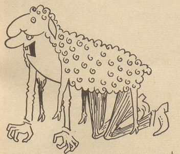
Wolf im Schafspelz

Jüngst wies ich hier darauf hin, daß die Chauffeure von Last- und Lieferwagen, die mit einer Firma-