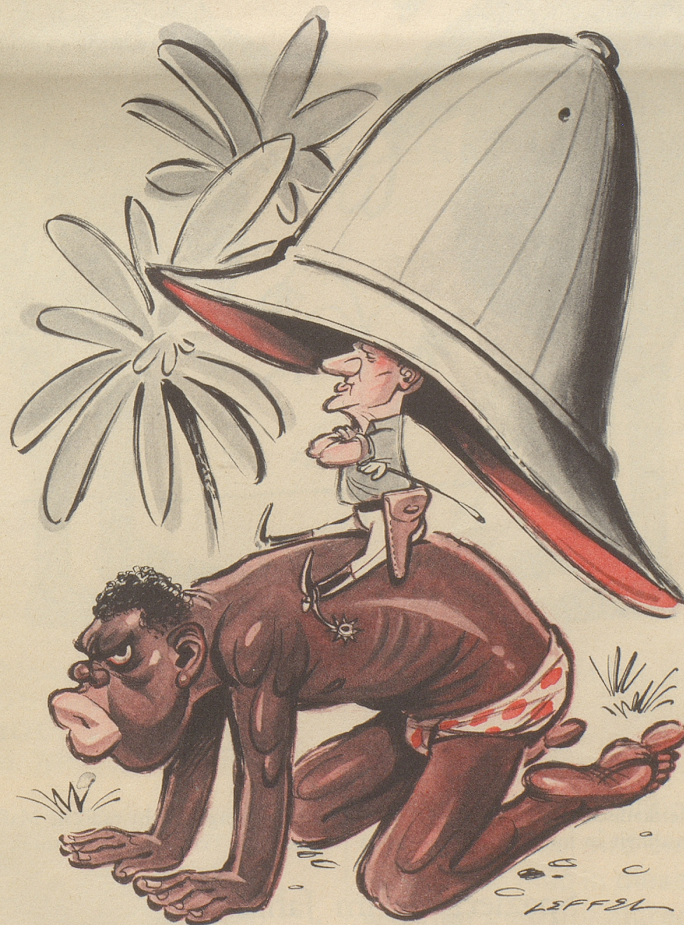
Seine Majestät I(w)an der Schreckliche von Rhodesien

Eine gegen den portugiesischen Diktator Salazar gerichtete Fernseh-sendung von Dr. Hugo Loetscher durfte nicht ausgestrahlt werden. Man habe zwar einen kritischen Bericht erwartet, sagten die Fernsehgewaltigen, aber eine Kritik, wie sie von Dr. Loetscher formuliert werde, dürfe man nicht senden. Nachdem bei uns der Baubeschluß aufgehoben ist, muß auch die Kritik wieder mehr denn je «aufbauend» sein.