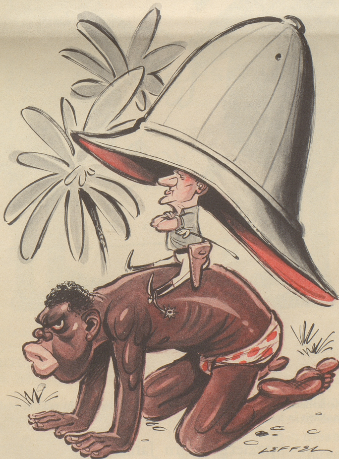
Seine Majestät I(w)an der Schreckliche von Rhodesien