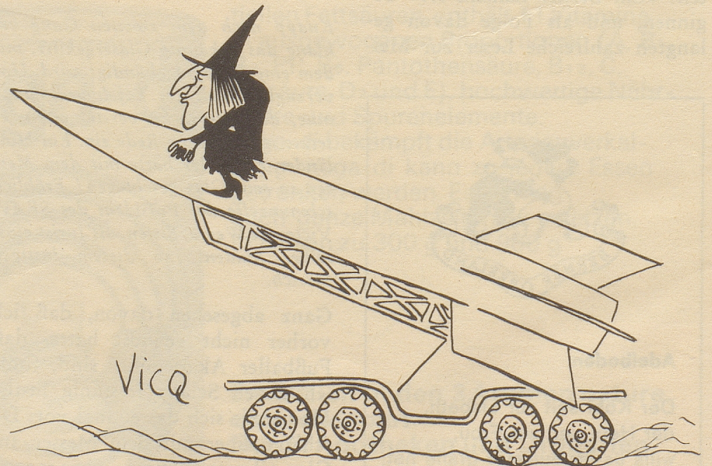
Hexe geht mit der Zeit

Nachdem das Kind ertrunken ist, deckt man den Brunnen zu. Vor den Wahlen haben die Regierungsparteien mit Milliarden um sich geworfen, um zu säen, wo sie auch zu ernten gedachten. Jetzt versichert Bundeskanzler Erhard mit