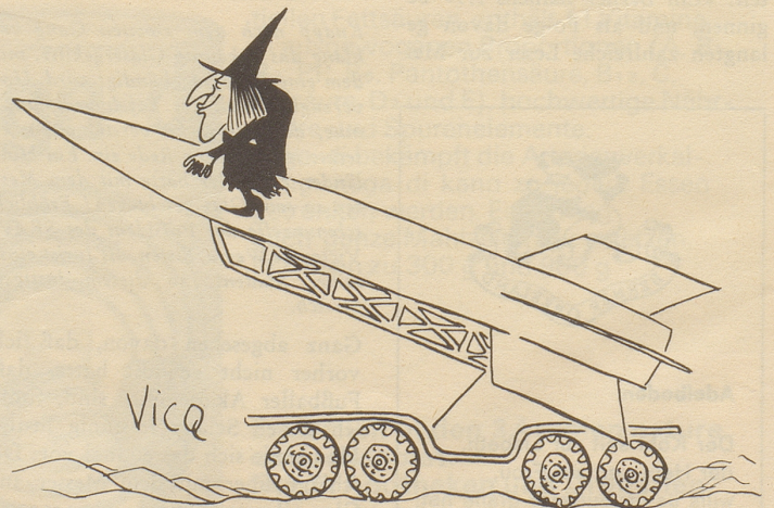
Hexe geht mit der Zeit

Nachdem das Kind ertrunken ist, deckt man den Brunnen zu. Vor den Wahlen haben die Regierungsparteien mit Milliarden um sich geworfen, um zu säen, wo sie auch zu ernten gedachten. Jetzt versichert Bundeskanzler Erhard mit