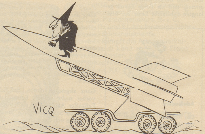
Hexe geht mit der Zeit

Nachdem das Kind ertrunken ist, deckt man den Brunnen zu. Vor den Wahlen haben die Regierungsparteien mit Milliarden um sich geworfen, um zu säen, wo sie auch zu ernten gedachten. Jetzt versichert Bundeskanzler Erhard mit