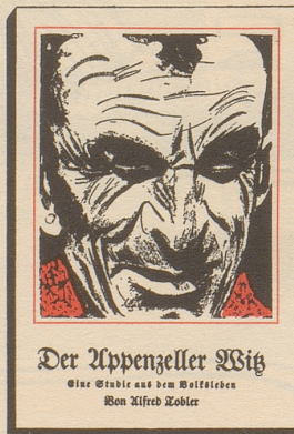
Der Appenzeller Witz