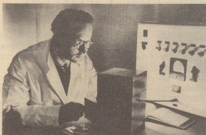
Wissenschaftlich bewiesen: Die Aufbau- stoffe von Neo-Silvikrin gelangen bis in die Haarwurzeln!

Bestimmt haben auch Sie schon dies oder jenes unternommen, um den Haarausfall aufzuhalten... und das Ergebnis??? Jetzt endlich brauchen Sie nicht mehr den Mut zu verlieren, denn es gibt ja Neo-Silvikrin — die auf der ganzen Welt anerkannte biologische Haarnahrung! Die erste Voraussetzung für die Wirksamkeit eines Haarpräparates ist: Seine Wirkstoffe müssen bis in die Haarwurzeln gelangen!