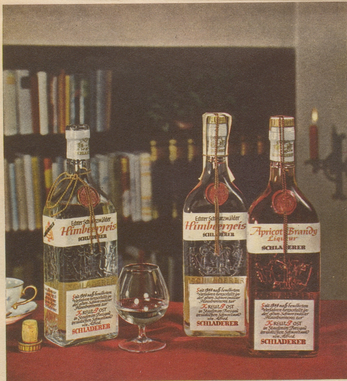
SCHLADERERS echter Schwarzwälder Himbeergeist und Aprikot

Schon der Duft verheisst höchsten Genuss – das vollkommene Aroma übertrifft Ihre Erwartungen!