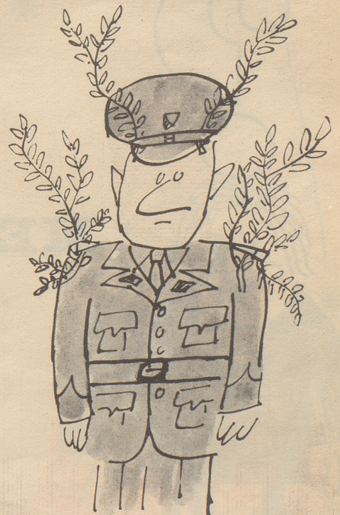
Der ,Tarn-Trick‘. In der Armee seit Jahren erprobt, erzielt dieser Trick auch bei der Polizei immer wieder eine verblüffende Wirkung.