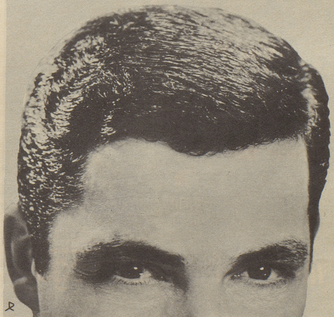
Parfümerie Franco-Suisse, Ewald & Cie. AG, Pratteln/Basel