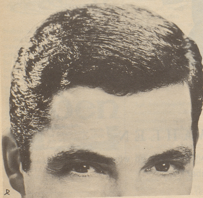
Parfumerie Franco-Suisse, Ewald & Cie. AG, Pratteln/Basel