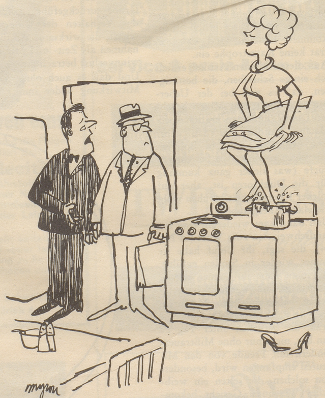
«Bringen Sie ihr doch bitte bei, daß es noch eine andere Art gibt, Kartoffelstock zuzubereiten»

Bethlis Glosse in Nr. 33 über die schönen Bilder (bei uns werden sie von Beamten bei Inventaren gerne diskret als «Tableaux» aufgeführt!) hat mir das Jahrzehnte zurückliegende Erlebnis eines wirklichen Kunstmalers im Zürichbiet in Er-