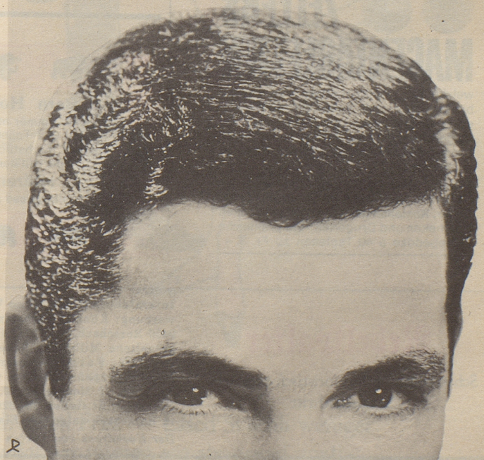
Parfumerie Franco-Suisse, Ewald & Cie. AG, Pratteln/Basel