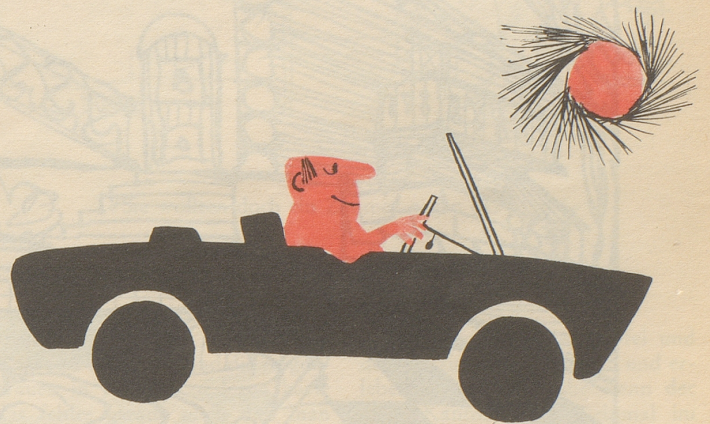
Mensch und Auto Anpassung