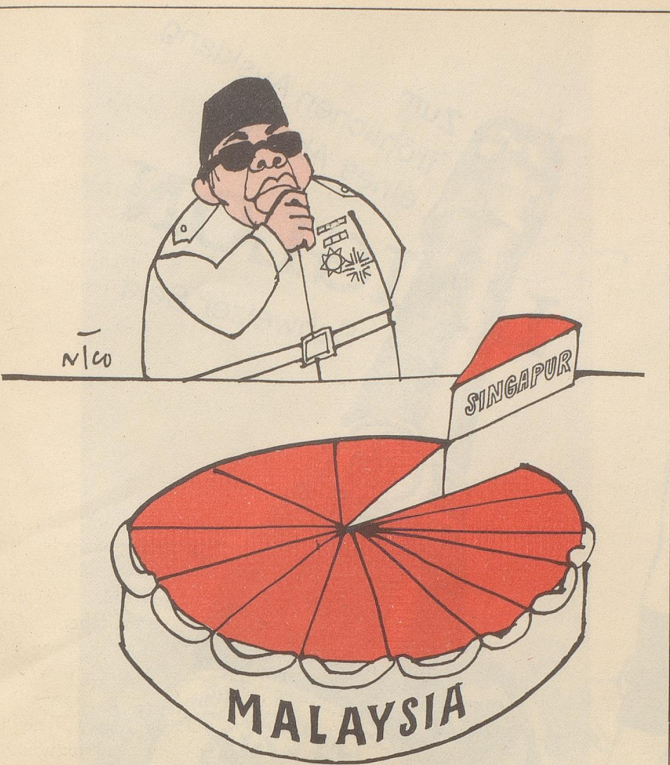
Singapur verläßt die Föderation Malaysia Ein gefundenes Fressen für Sukarno