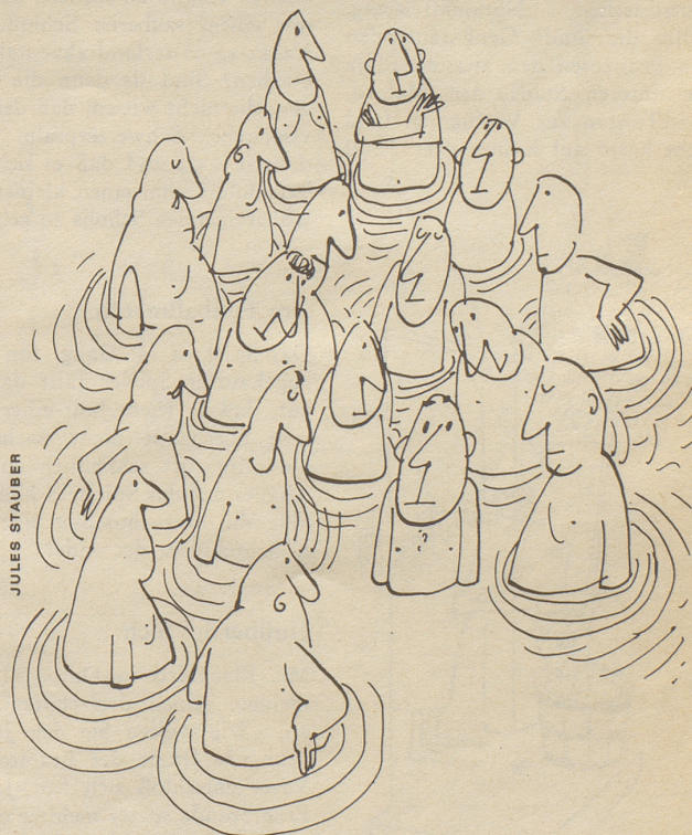
«Ein typischer Nonkonformist! Jeder normale Mensch schlägt doch Wellen!»