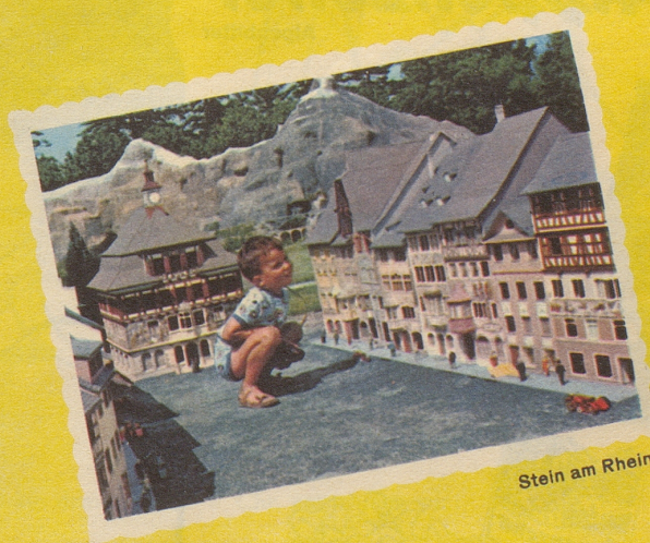
Stein am Rhein

Besuchen Sie die Swissminiatur in Melide bei Lugano