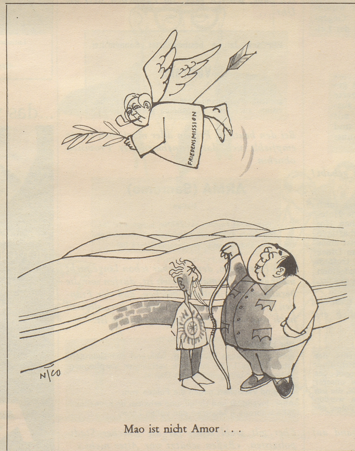
Mao ist nicht Amor ...

Der Bundesrat verlangt einen Kredit von 15 Millionen zum Ausbau der Eidgenössischen Turn- und Sportschule Magglingen. Unsere Regierung tut gut daran, den Leistungssport zu fördern. Meldungen über Schweizer Sporterfolge neh-