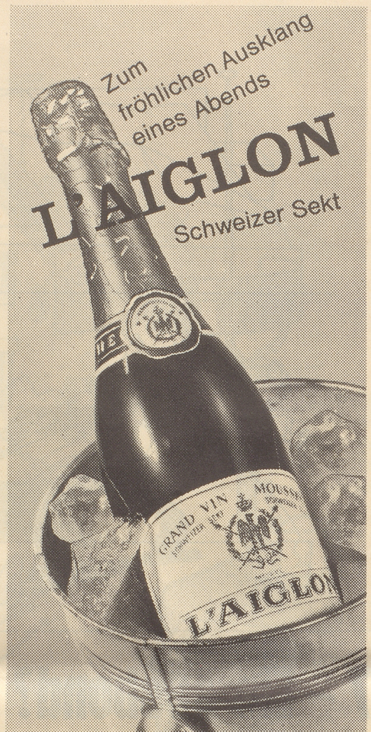
L'Aiglon est élaboré en cuve close par Bourgeois Frères & Cie SA, Ballaigues Ab Fr. 5.60

Lies den «Nebi» schon am Morgen, er verbannt die Alltags-Sorgen!