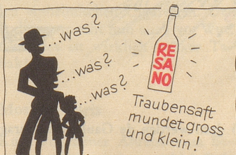
Zu beziehen durch Mineralwasserdepots

Die Sowjetzonenbewohner sollten lieber Leuchtstoffröhren regelmäßig reinigen, statt nach Röhren