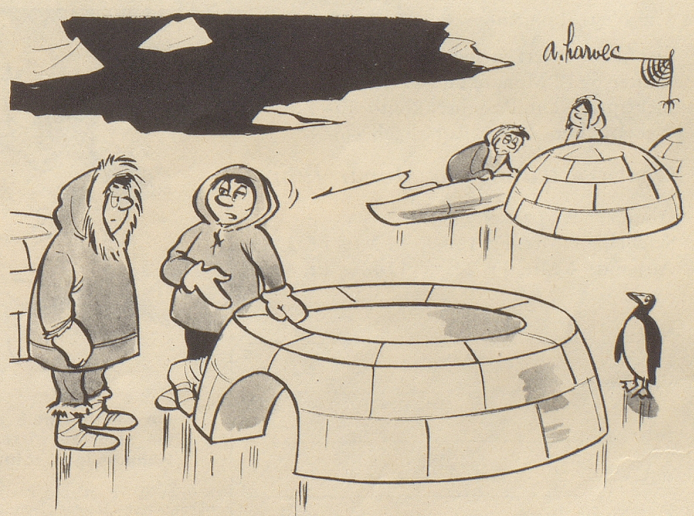
«Unzuverlässig sind diese Handwerker — Seit drei Wochen warte ich auf den Dachdecker!»

Dies gelesen (in einer Filmkritik, notabene): «Würde man den Streifen chemisch reinigen, bliebe nichts als gähnende Langeweile.» Und das gedacht: Und was bliebe vom Filmkritiker, nach chemischer Reinigung?