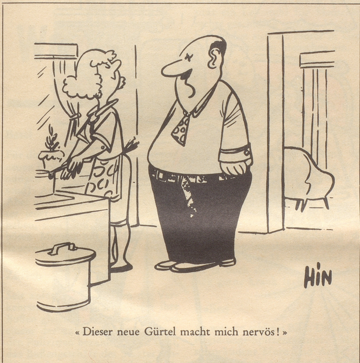
«Dieser neue Gürtel macht mich nervös!»

Im «Vaterland» gefunden von St. G., Luzern