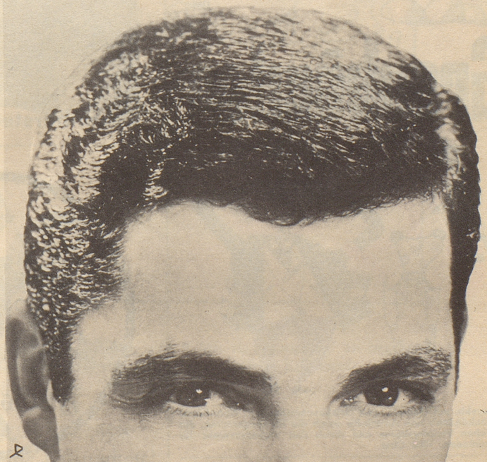
Parfumerie Franco-Suisse, Ewald & Cie. AG, Pratteln/Basel