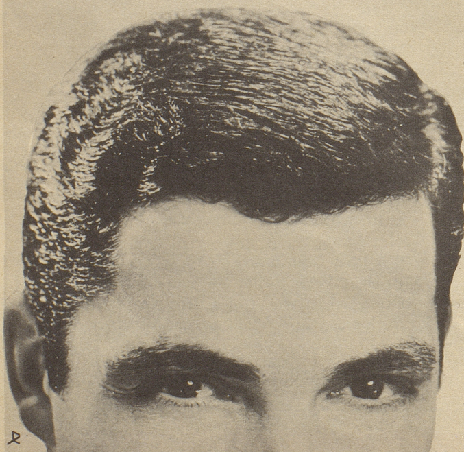
Parfumerie Franco-Suisse, Ewald & Cie. AG, Pratteln/Basel