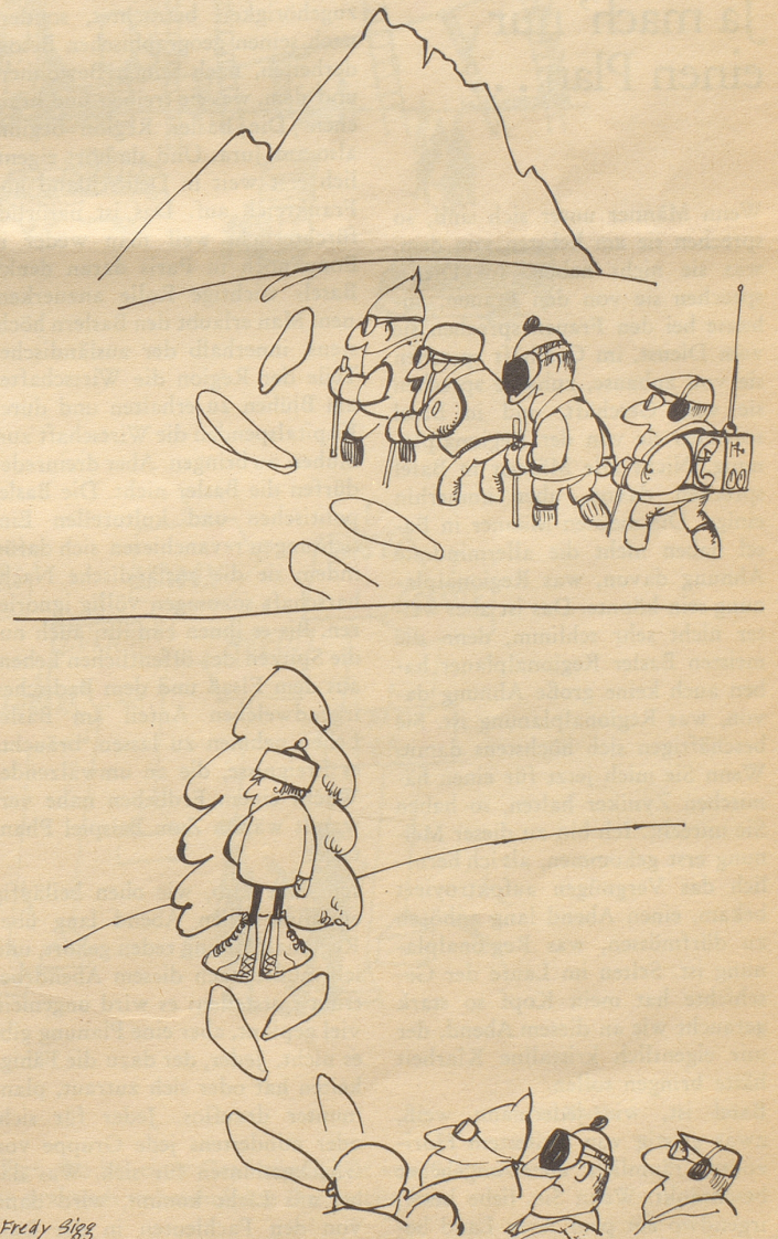
Auf den Spuren des Yeti

Feuer breitet sich nicht aus, hast Du MINIMAX im Haus!