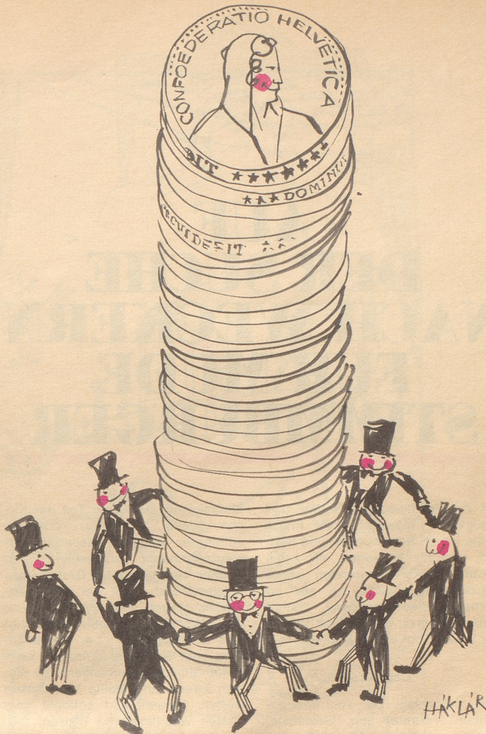
Die Fiskaleinnahmen des Bundes erreichten im Jahre 1964 den Rekordbetrag von viereinhalb Milliarden Franken.

Ich sehe fern und hoffe, Chruschtschow tue das auch. Eine Abwechslung, die weniger Anstrengung als diese kostet, gibt es gar nicht. Dazwischen lese ich die Zeitung und stelle fest, daß die Nachfolger auf unsern Verwaltungsbüros noch viel schönere Pannen haben als wir seinerzeit. Chruschtschows Genugtuung auf diesem Gebiet muß ähnliche Dimensionen haben. Es ist nicht ganz schön, ich weiß es, aber ungeheuer wohltuend. Die Fehler unserer Nachfolger tragen mehr zum Wohlbefinden des Rentnerstandes bei, als man gemeinhin annimmt. Von dieser Warte aus betrachtet kann es Chruschtschow nur gut gehen, und ich denke auch nicht, daß er mit seiner Ruhestandserfahrung zurück an die Macht will. Uebrigens, in zehn Minuten beginnt der Fernsehkrimi; die Televisionsprogramme stehen in meiner Agenda wie früher die Sitzungen.