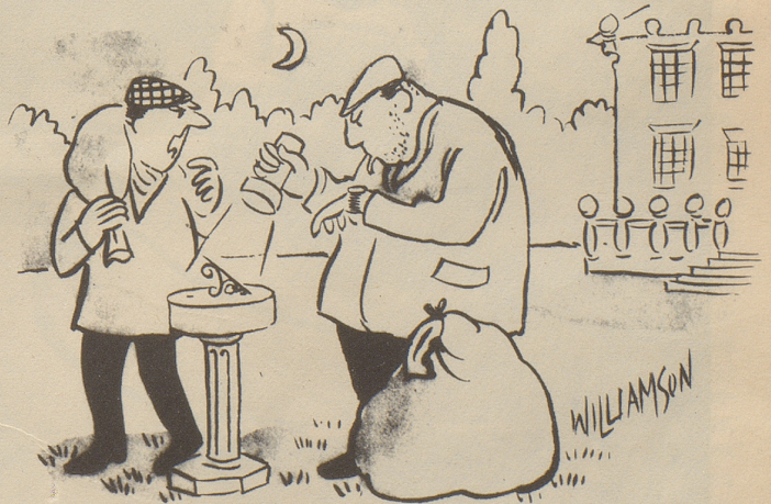
«Jaja, Deine Uhr geht genau — aber komm jetzt!»