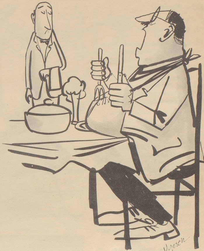
«Sie Garçon — a dem Bifftegg häts ja nüüt als Fett!»

Das ist das Erfreuliche an unserer Zeit: Zu sein, genügt nicht mehr. Dr. med. Politicus