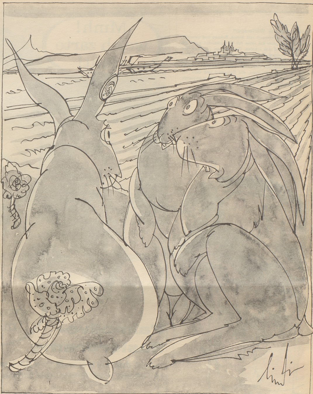
Im Kanton Genf wurden zur Ergänzung des Wildbestandes 250 aus Ungarn eingeführte, durch Metallmarken im Ohr gekennzeichnete Hasen ausgesetzt.

Zwei Millionen Schweizer werden die Expo als Automobilisten besuchen. Weitere zwei Millionen werden in Lausanne herumbummeln und sich bei der Gelegenheit zum Fußgängertum bekennen. In der Zeitung lesen wir ferner, die SBB wolle täglich in Lausanne mindestens 15 000 Personen ausladen. Wenn wir auch zugeben, daß es darunter Ausländer hat, so kommen wir trotzdem auf weitere zwei Millionen Schweizer Zugreisende. Weiter bedenke man: Es gibt Hunderttausende von Sängern, Schützen und Turnern, fast ebensoviele Sängerinnen, Jodler, Kegler, Unteroffiziere, Radfahrer, Radiohörer, Naturfreunde, Schwinger, Fußballer, Alpenklübler, Fernseher, Frauenstimmrechtlerinnen, Skiklüber, Markensammler, Sparer, Rentner, Straßenbahnpassagiere, und so weiter. Jedermann leuchtet es ein: Wenn man sie summiert, so hat man leicht die sechs Millionen beieinander, die zur Rechtfertigung der New York Times noch fehlen.