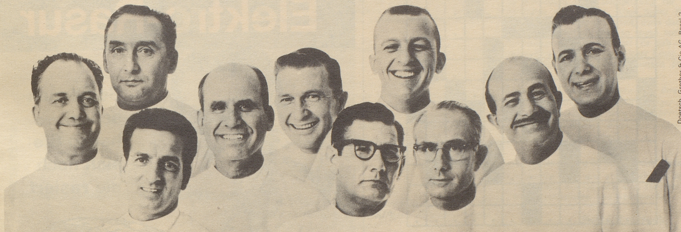
Doetsch, Grether & Cie AG, Basel 2