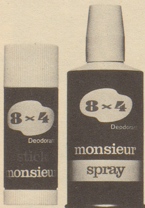
Stick monsieur Fr. 3.60