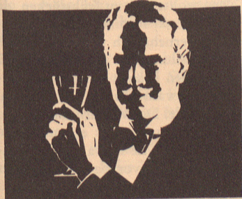
Die richtige Folge ...

Weihnachten ist bei den Kommunisten ein heiteres winterliches Fest. Diese Auslegung hilft ihnen, mit dem Baumschmuck dennoch ein