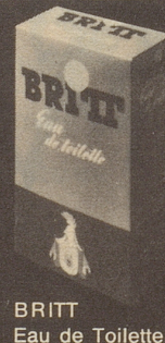
BRITT Eau de Toilette 80°