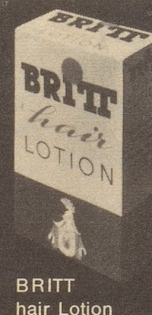
BRITT hair Lotion