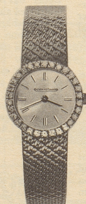
14027 30 Brillanten 18 Kt. Weissgold Fr. 3875.-

* Anlässlich der Landesausstellung 1964 veranstaltete die Schweiz. Uhrenindustrie einen Wettbewerb. Das oben abgebildete Savonnet-Modell aus Platin mit 56 Brillanten und 53 Saphiren erhielt den Ehrenpreis in der Kategorie Brillantuhren. Es ist die kleinste Uhr der Welt. Ihr Werk wiegt mit Zifferblatt und Zeigern nur 1,02 Gramm, doch ist es vierhundertmal sein Gewicht in reinem Gold wert. Einige wenige Exemplare sind von Jaeger-LeCoultre für den Verkauf freigegeben worden. Preis ca. Fr. 20 400.-