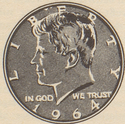
John F. Kennedy

Dieses schöne Geldstück nimmt jeden Tag an Wert zu