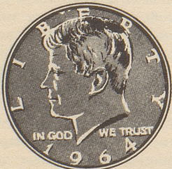
John F. Kennedy

Dieses schöne Geldstück nimmt jeden Tag an Wert zu