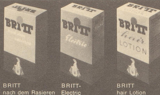
BRITT nach dem Rasieren