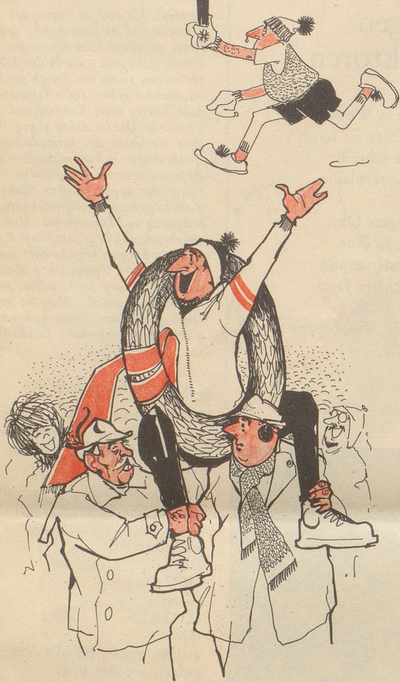
«Ja mei, dös is a Rekord, der Wastl ist 34 Hundertstel-Sekunden eher herunten gwesen, als wie er droben abfahn is.»