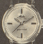
6001 Stahl Fr. 278.- Goldplaque Fr. 295.- 18 K Gold Fr. 495.-