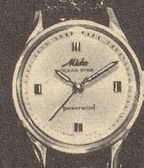
6021 Stahl Fr. 285.- Goldplaque Fr. 295.-