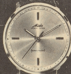
4001 Stahl Fr. 265.- Goldplaque Fr. 325.-