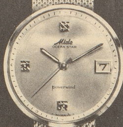
44007 AG Stahl mit Stahlband Fr. 335.-