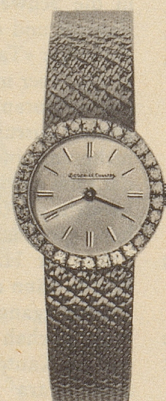
14027 30 Brillanten 18 Kt. Weissgold Fr. 3875.-

* Anlässlich der Landesausstellung 1964 veranstaltete die Schweiz. Uhrenindustrie einen Wettbewerb. Das oben abgebildete Savonnet-Modell aus Platin mit 56 Brillanten und 53 Saphiren erhielt den Ehrenpreis in der Kategorie Brillantuhren. Es ist die kleinste Uhr der Welt. Ihr Werk wiegt mit Zifferblatt und Zeigern nur 1,02 Gramm, doch ist es vierhundertmal sein Gewicht in reinem Gold wert. Einige wenige Exemplare sind von Jaeger-LeCoultre für den Verkauf freigegeben worden. Preis ca. Fr. 20 400.-