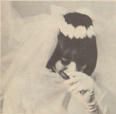
die sich kurz vorher schrecklich erkältet hatte.