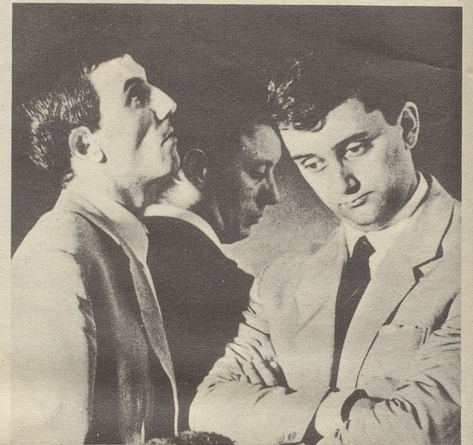
Und so wurde die Stimmung gedämpfter, immer gedrückter...