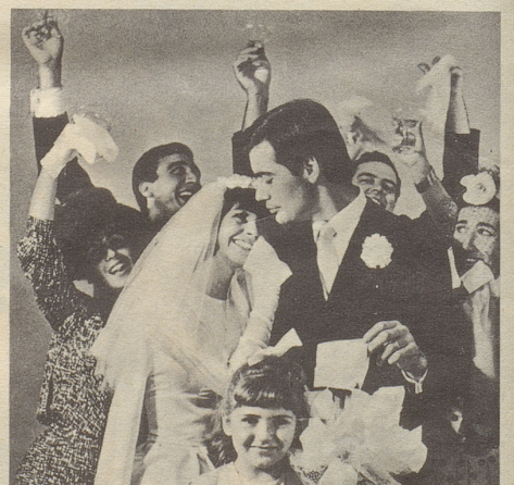
Und es gab genug Kleenex-Tüchlein für das Brautpaar und alle 98 Gäste.

Und hopp! KLEENEX auch für Sie... weich (für die empfindlichste Nase), stark (für den grössten Schnupfen) und - natürlich - blütenrein (denn jedes KLEENEX ist nigelnagelneu).