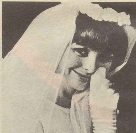
Kleenex – das so weich ist für empfindliche Näslein!