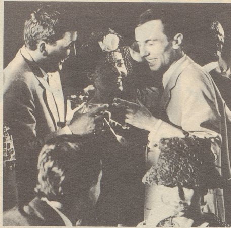
Alle unterhielten sich glänzend am Hochzeitsfest.