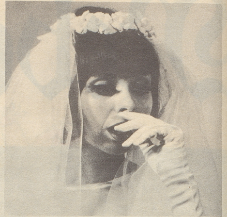
Alle – ausgenommen die hübsche junge Braut,