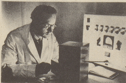
Wissenschaftlich bewiesen: Die Aufbaustoffe von Neo-Silvikrin gelangen bis in die Haarwurzeln!

Bestimmt haben auch Sie schon dies oder jenes unternommen, um den Haarausfall aufzuhalten... und das Ergebnis??? Jetzt endlich brauchen Sie nicht mehr den Mut zu verlieren, denn es gibt ja Neo-Silvikrin — die auf der ganzen Welt anerkannte biologische Haarnahrung! Die erste Voraussetzung für die Wirksamkeit eines Haarpräparates ist: Seine Wirkstoffe müssen bis in die Haarwurzeln gelangen!