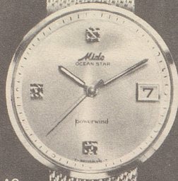
44007 AG Stahl mit Stahlband Fr. 335.-