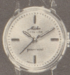
6001 Stahl Fr. 278.- Goldplaque Fr. 295.- 18 K Gold Fr. 495.-