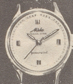
6021 Stahl Fr. 285.- Goldplaque Fr. 295.-