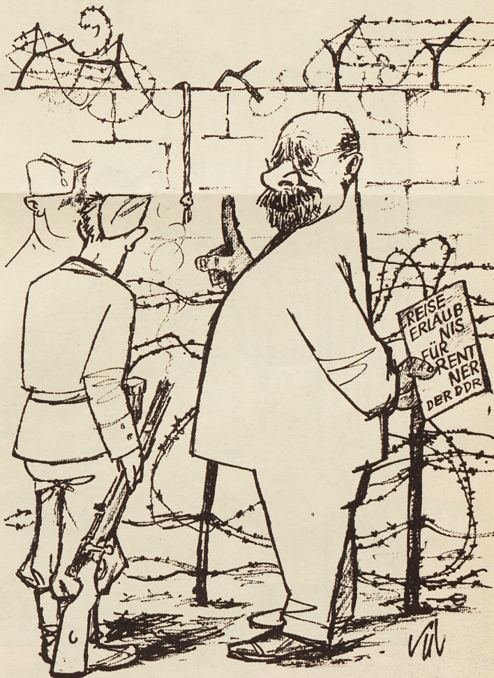
Ab 2. November soll es den Pensionierten der Sowjetzone erlaubt sein, jährlich eine Besuchsreise nach Westdeutschland zu machen. Wenn jedoch ein Junger zu seiner Braut in den Freien Westen hinüber möchte, wird, wie das kürzlich einem einundzwanzigjährigen Ostberliner geschah, auf ihn geschossen.

Es wäre übrigens auch kein Unheil entstanden, wenn Gulliver alle Fragen hätte stellen dürfen, die ihm am Herzen lagen. Und auch die statistischen Ergebnisse sollten nicht geheimgehalten werden, sie werden vielleicht doch den einen oder andern Fingerzeig bringen. Ich persönlich habe bereits einen mit nach Hause gebracht: Mit meinen Antworten lag ich im großen und ganzen, so erklärte mit elektronischer Prompttheit Freund Gulliver, in der Nachbarschaft der «Welschschweizer und Tessiner, bei Personen welche über fünfzig Jahre alt sind und welche nur die Primarschule absolviert haben.» Danke für die Auskunft! Dr. med. Politicus